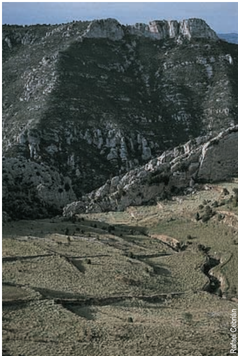
campos de Bel

entidad promotora: Centro Excursionista de Castellón