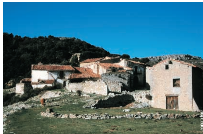
Mas d'en Segures